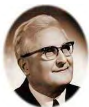
Kalmár László (matematikus)